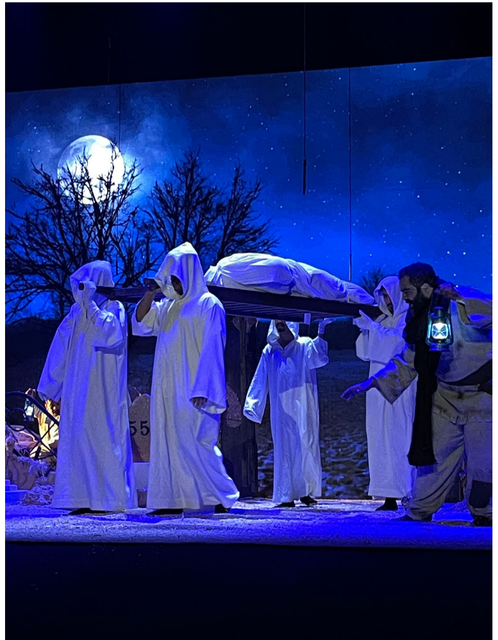
مشهدان من مسرحية "بدل فاقد" التي قدمها نادي "آرين المسرحي" أمس الأربعاء ضمن عروض المهرجان على مسرح جامعة الملك سعود في الرياض.