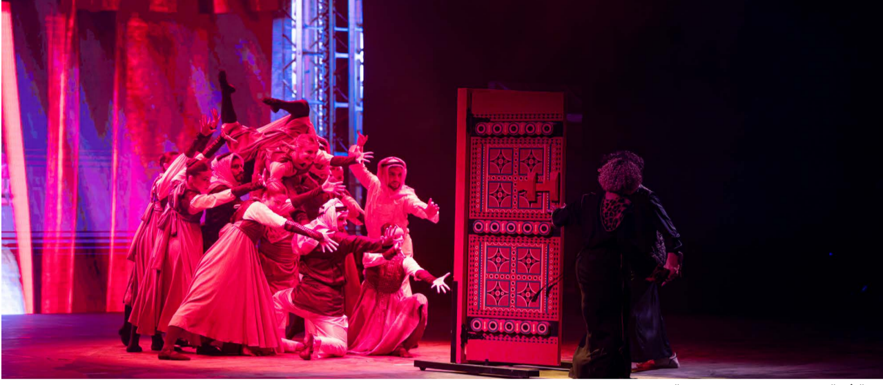
لوحة فنية من العرض المسرحي «رحلة هاوي».