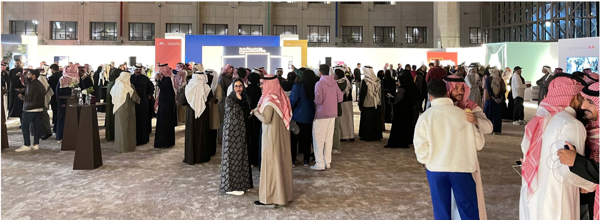
جانب من الحضور في المعرض.