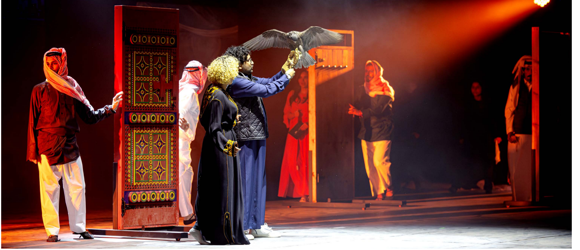
جانب من العرض المسرحي «رحلة هاوي» خلال حفل الافتتاح.